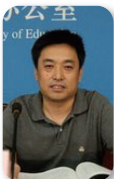
教育部基础教育司司长 吕玉刚