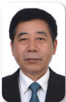
教育部党组书记、部长 陈宝生