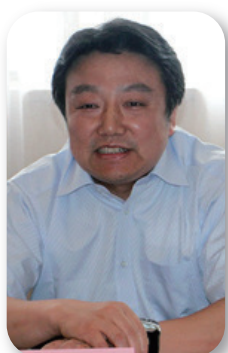
教育部发展规划司司长 刘昌亚