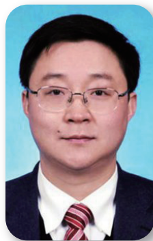
科大讯飞董事长 刘庆峰