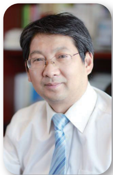
教育部学校规划建设发展 中心主任 陈锋