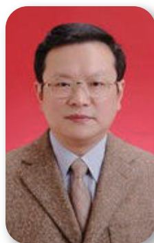
重庆市政府副市长 屈谦