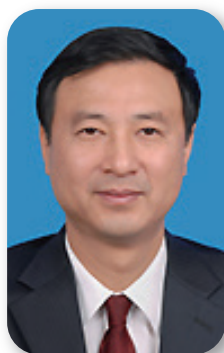
教育部党组成员、副部长 孙尧