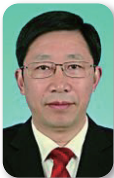
重庆市委教育工委专 职副书记 覃正杰