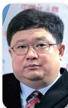
中国教育电视台台长 袁小平