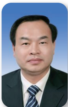
重庆市委副书记、市长 唐良智